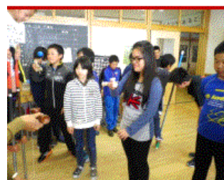
4月28日南小学校 伝統的遊び