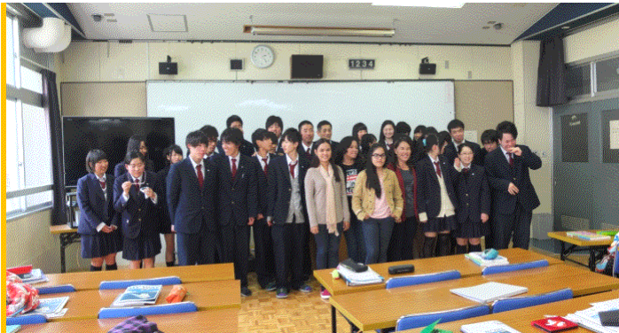
4月30日下諏訪向陽高校授業参加 音楽室にて記念撮影