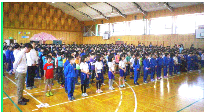
4月28日南小全校集会でご挨拶 ↑ 授業参加 ↓