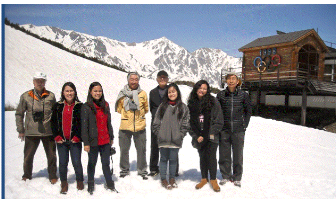
4月29日八方尾根で初めての雪体験