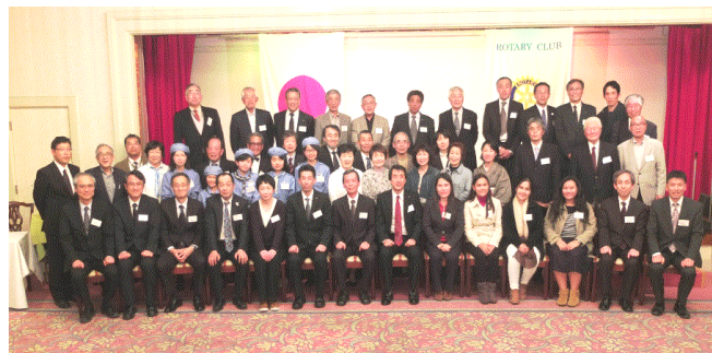
歓迎会 4月27日 マリオにて