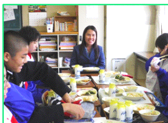
4月27日下中昼食を生徒たちとともに