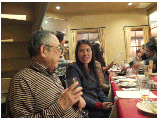
さよならパーティ