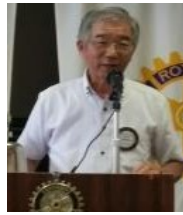
小松会員より 決算報告 がありました