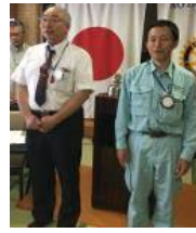
今月のお誕生日の お二人です。