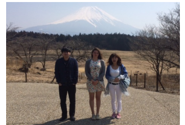
初めての富士山を記念に