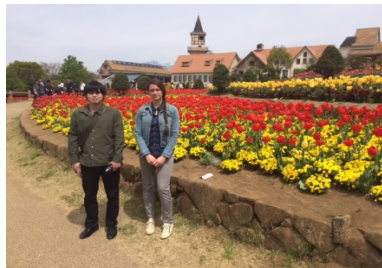
山梨県 ハイジの村にて