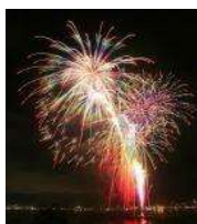
新作花火大会より