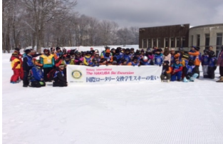
白馬RC主催『交換学生スキーの集い』に参加して