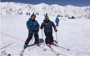
白馬八方尾根山頂にて