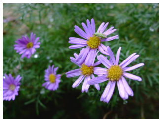
クジャクアスター