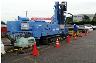
地中熱利用融資システムの普及・拡販