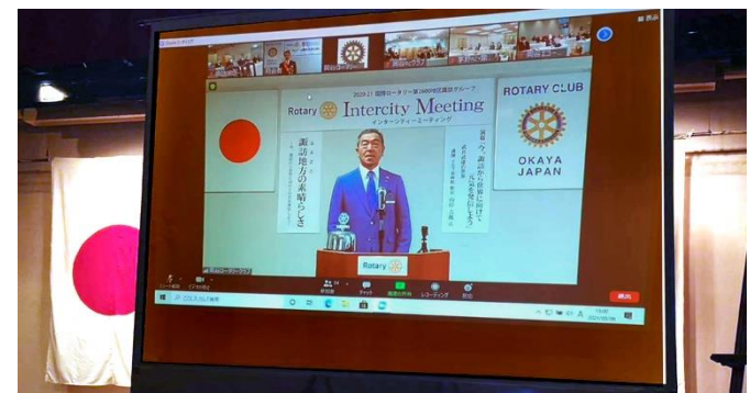
中村岡谷ロータリークラブ会長挨拶