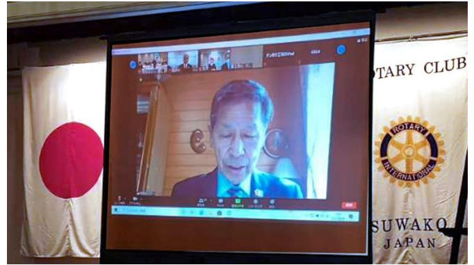
成田ガバナー挨拶

それでもせっかくの機会ということで諏訪湖ロータリークラブはライフプラザマリオへ皆で集まって参加しました。また食事の時間がうまく取れないこともあり急遽「友愛の広場」を設営しましたが大変好評で楽しくIMに参加ができました