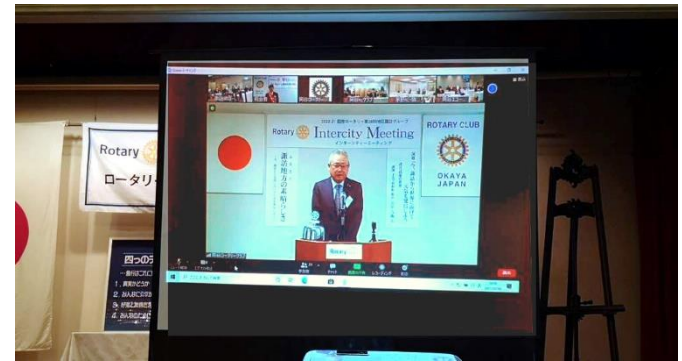
矢島諏訪グループガバナー補佐挨拶