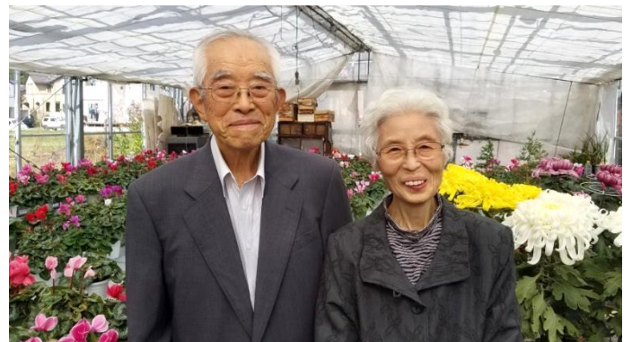
35周年記念誌に記載されたお写真