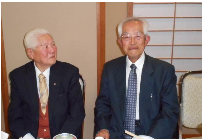
米寿のお祝いにて