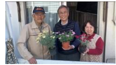
2020年3月コロナ禍のメッセージ。結局例会が開かれず、この後事務局までお花を届けてくれました