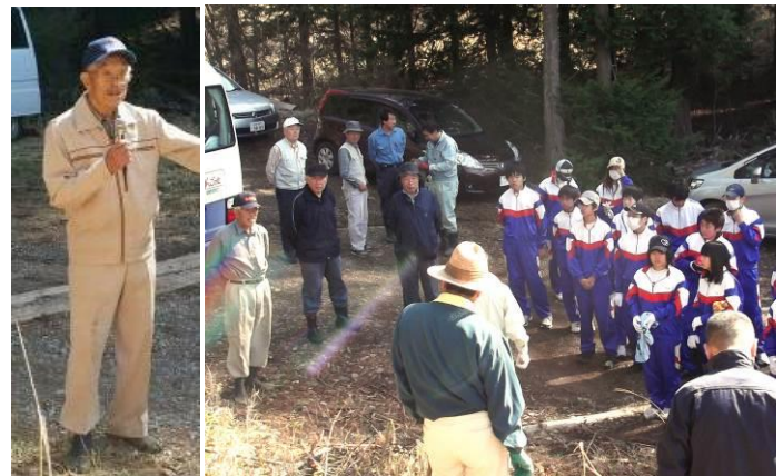
ブナの森にて子供たちにお話し