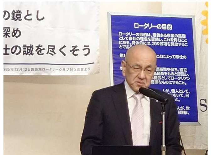
卓話をいただいた宮坂PG