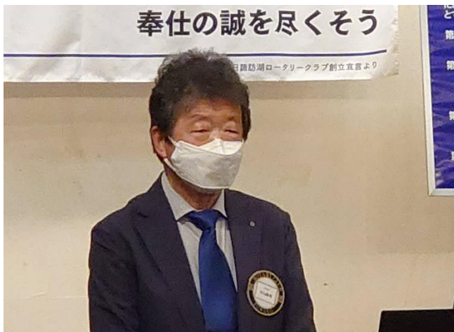
趣旨説明の平山職業奉仕委員長