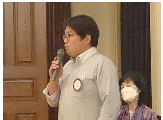
3人の子持ちになった小笠原青少年奉仕委員長