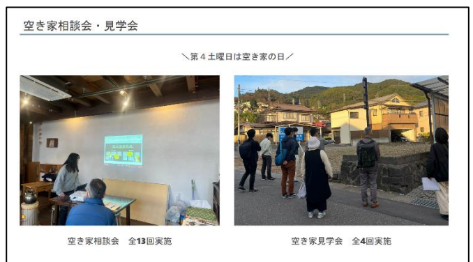
空き家相談会 全13回実施