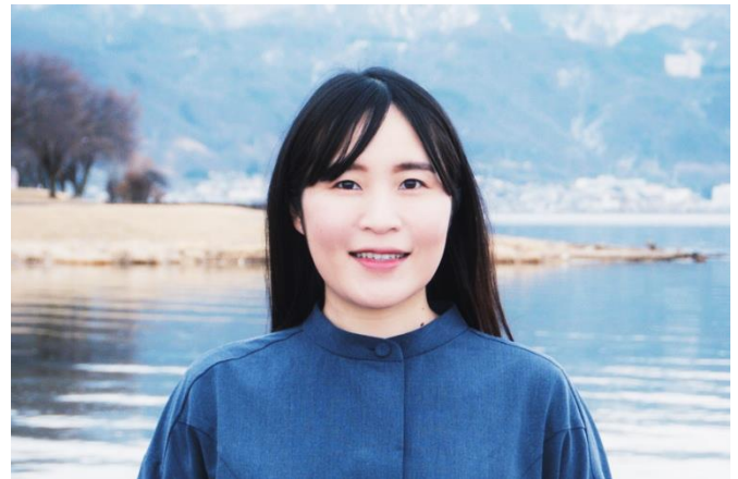
下諏訪移住のきっかけは「登山にはまる」