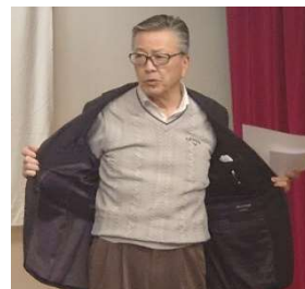
喜びながら出席報告(高山会員)