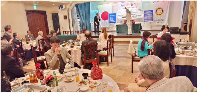
全員にお土産賞品あり