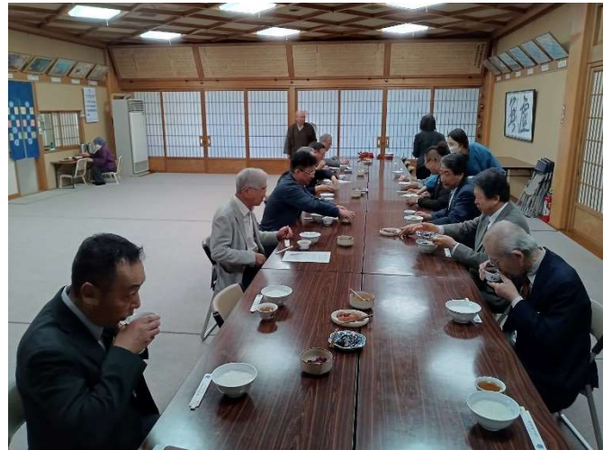
早朝からお粥をご用意いただき、ありがとうございました。