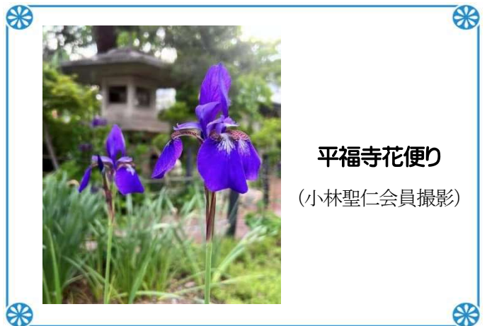
平福寺花便り